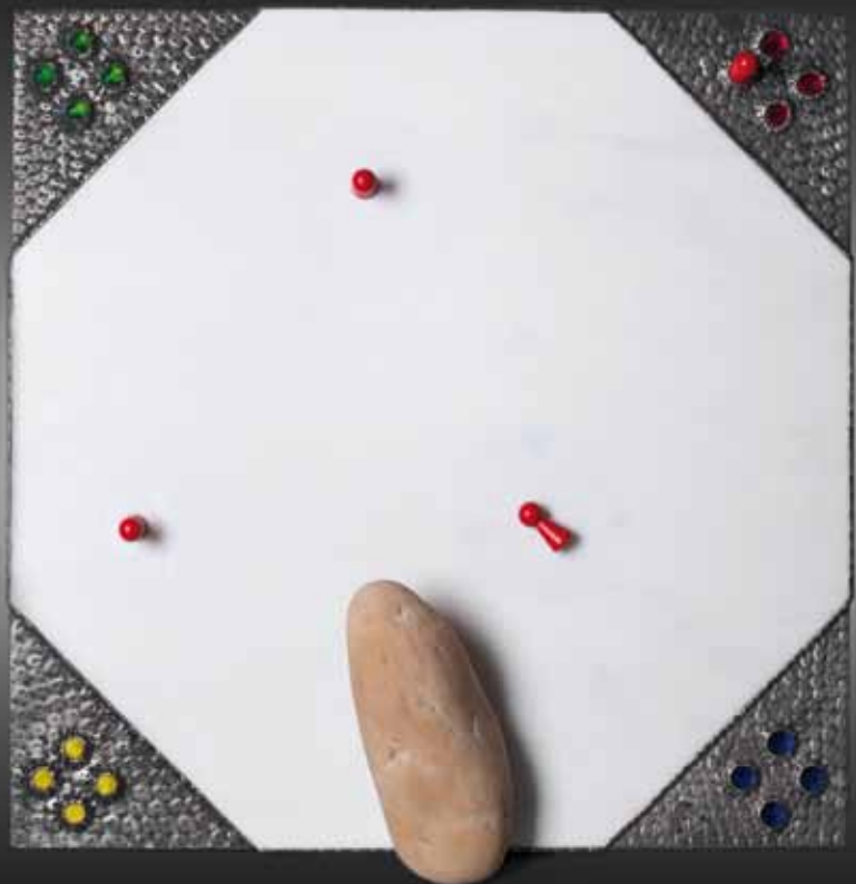
deniseX!: Brot und Spiele